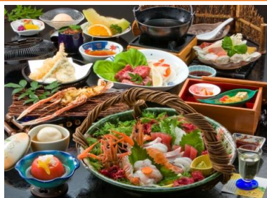
海の幸「天然アカザエビ」