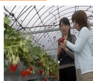
年間で楽しめるフルーツ狩