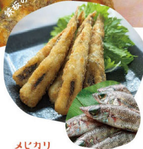
鉄板のメヒカリの唐揚げ！

蒲郡は年間の日照量も多く、施設栽培が盛んな地域。生産者の努力の結晶の「赤い宝石」を味わってください。