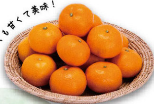
とっぴもがっく美味！