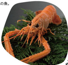
エビ界のプリンセス

水深200~400mに生息する日本固有のエビ。養殖できないため非常に高級な食材です。身は非常に柔らかく、旨味、甘味の強い美味しさが特徴。