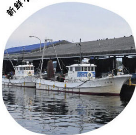
新鮮な深海魚を水揚げ！

愛知県内に4隻しかない、深海魚を獲る「沖合底引き網漁船」。そのすべてが蒲郡市内の漁港に所属しているため、蒲郡は深海魚のまちとしても有名。実は県内の9割以上の深海魚は蒲郡で水揚げされています。深海の水圧に耐えるために脂の乗りがよく、大変美味しいことで知られる深海魚。特に三河湾の豊富な栄養が流れ込む三河湾沖の深海は、全国有数の恵まれた漁場と言われており、蒲郡で獲れる深海魚はとても美味しいと評判です。