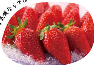
温暖な気候ならでは！

海と山に囲まれた温暖な気候で、温室みかん、露地みかん栽培が盛ん。1年を通して様々な品種のみかんが楽しめます。