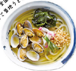
ご当地うどんの全国大会が三冠達成！ 日本一のご当地うどん！