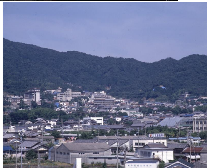
三ヶ根山の麓に広がる温泉地～形原温泉～