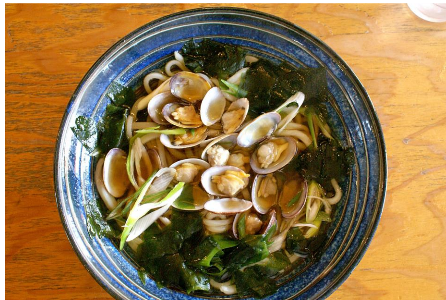
蒲郡うどん得盛 三河湾産あさりを使用した名物「ガマゴリうどん」