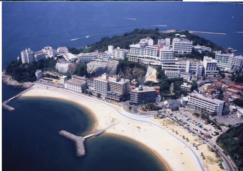
西浦半島の先端、海水浴場を臨む～西浦温泉～