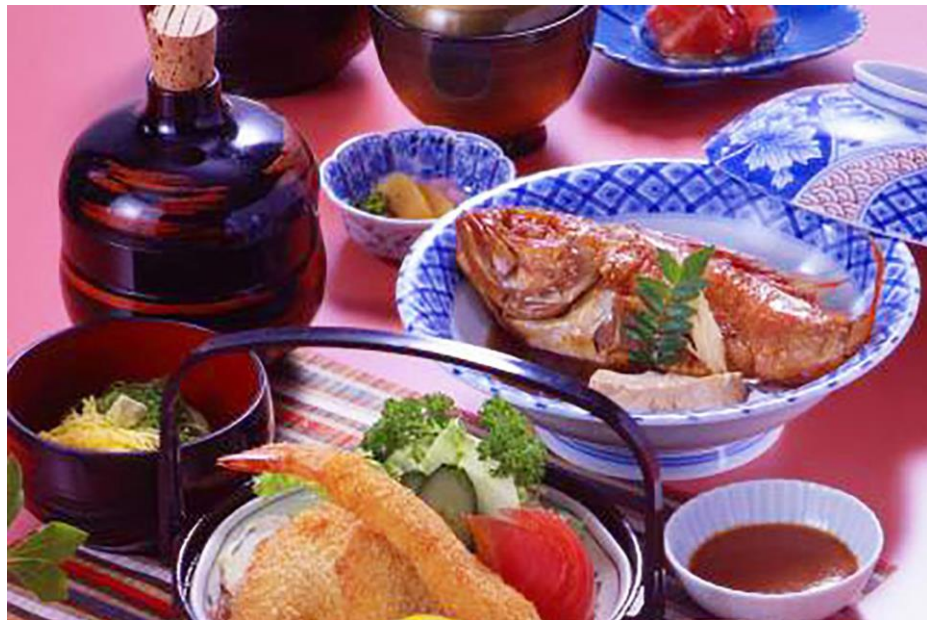
料理のうえむら 地元の魚を一匹煮魚にした定食「三河膳」