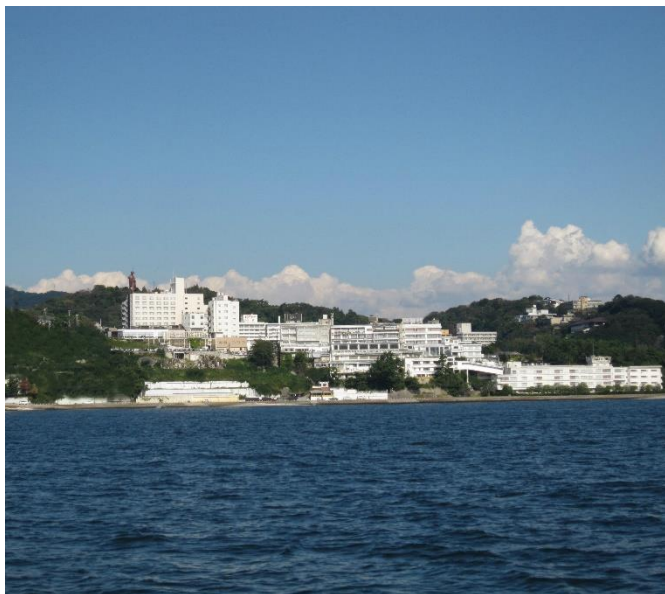
1200年の歴史ある温泉地～三谷温泉～