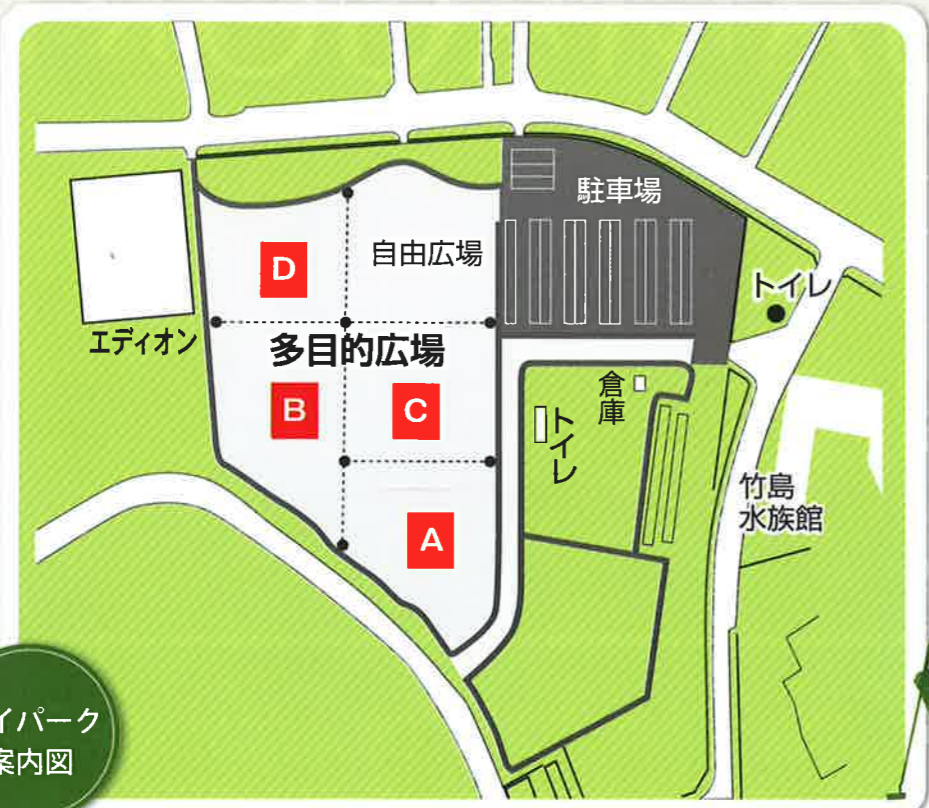
ベイパーク案内図