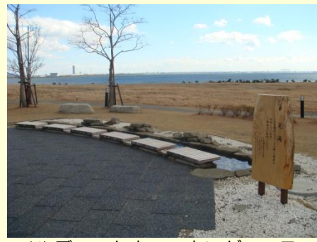
ノルディックウォーキングコースの途中に足湯(無料)があります